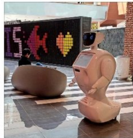
Una de las propuestas digitales más innovativas del nuevo mall son sus robots anfitriones, los cuales cuentan con tecnología de reconocimiento facial y voz.

Asimismo, el centro comercial cuenta con un software de reconocimiento facial, que es operado por la PDI, y unas 259 cámaras digitales con tecnología IP. En cuanto a medición de flujos y mejoras de servicio, la firma desarrolló una aplicación que permite a los usuarios conocer el cobro de estacionamiento por su estadía, entre otros.