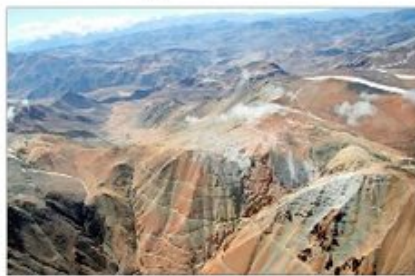
REVISIÓN.— La canadiense Barrick se encuentra realizando una optimización del proyecto, el que ahora será una operación subterránea.

El plan aprobado contempla el cierre de todas las instalaciones mineras ubicadas en el lado chileno del proyecto binacional y de sus operaciones auxiliares, excepto las vinculadas con los compromisos ambientales.