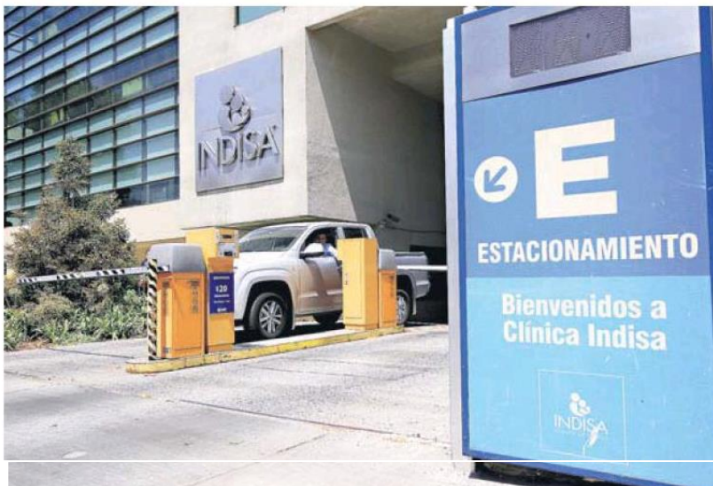
►► Estacionamiento de la Clínica Indisa, ubicada en Providencia.

medida de los proveedores de estacionamientos y malls”, concluyó Chahín.