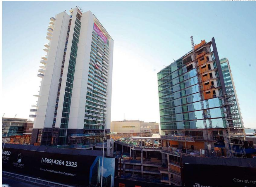
MATÍAS QUILODRÁN LUCERO

A cinco años, la inversión sectorial en el país se prevé en torno a los US$8.422 millones, según la cartera de proyectos al cierre de junio. Un 69,7% corresponde a edificaciones del tipo habitacional (casas y departamentos); un 16,1% a edificaciones no residenciales; y, un